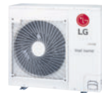
Multi F Buitenunit Voeding 230 V + N