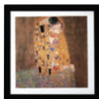
ARTCOOL Gallery DUAL Inverter